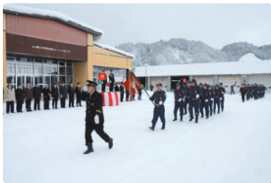
上小阿仁村消防団